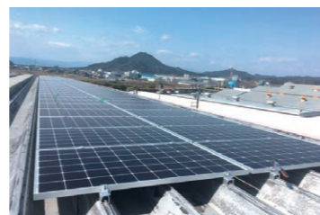
当社物流倉庫屋上の太陽光パネル

当社子会社（80%出資）「株式会社モデル・ティ」は、全国の携帯電話ショップを中心に、未利用屋根を活用した再生可能エネルギー電力事業を2018年度より開始しました。