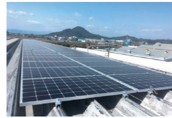
当社物流倉庫屋上の太陽光パネル

当社連結子会社「株式会社TGパワー」は、全国の携帯電話ショップを中心に、未利用屋根を活用した再生可能エネルギー電力事業を2018年度より開始しました。