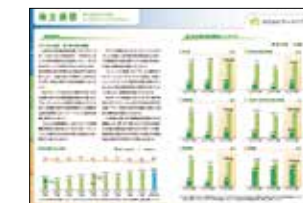
第1四半期の株主通信

冊子での配布は半期ごとですが、当社のホームページにて、四半期決算ごとの株主通信を開示しております。今後も株主・投資家の皆様に対して、積極的なIR活動を行ってまいります。