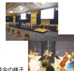
株主総会・懇談会の様子

2013年6月20日、第22回定時株主総会を開催し、報告事項のご説明、決議事項の採決をさせていただきました。また、総会終了後には、当社をより一層ご理解いただくために、株主の皆様との懇談会を実施いたしました。