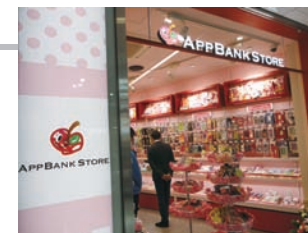
APPBANK STORE® ※AppBank Store®はAppBank Store株式会社の登録商標です。

住所: 東京都渋谷区神宮前 1-7-1 CUTE CUBE HARAJUKU 1F TEL:03-5413-5498 アクセス: JR「原宿駅」、東京メトロ千代田線「明治神宮前」徒歩3分 竹下通り沿い