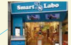
Smart Labo 仙台クリスロード(宮城県)