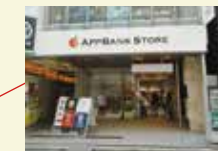
AppBank Store 新宿(東京都)