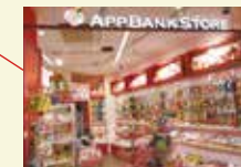
AppBank Store 原宿(東京都)