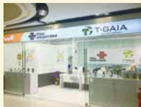
チャイナユニコムショップ 威宁路(ウェイニンルー)店